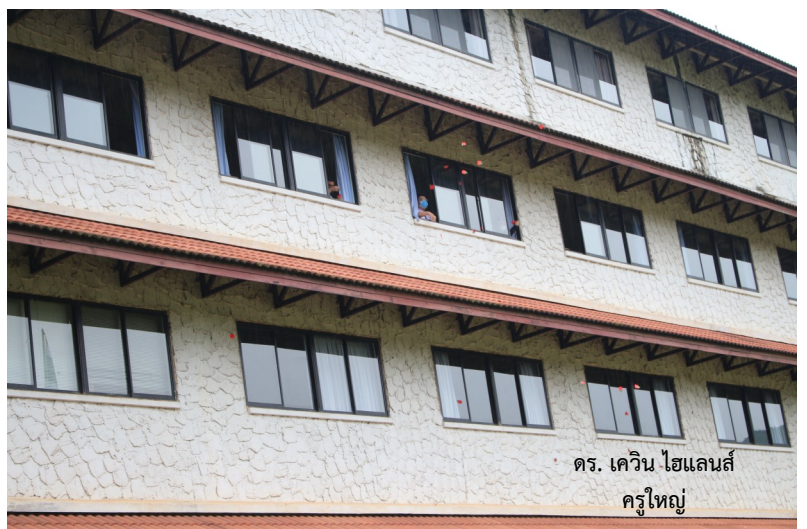
ดร. เควิน ไฮแลนส์ ครูใหญ่